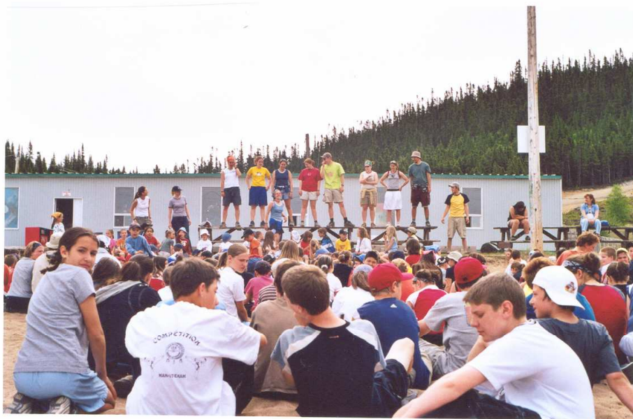
Groupe de moniteurs qui préparent une activité avec les jeunes.