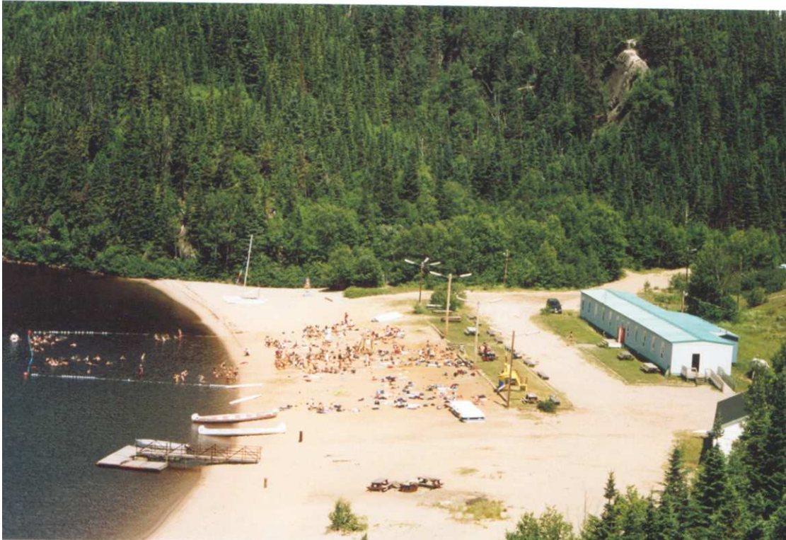
Plage du Lac Rapide ainsi que bâtiment pour entreposer l'équipement nautique.