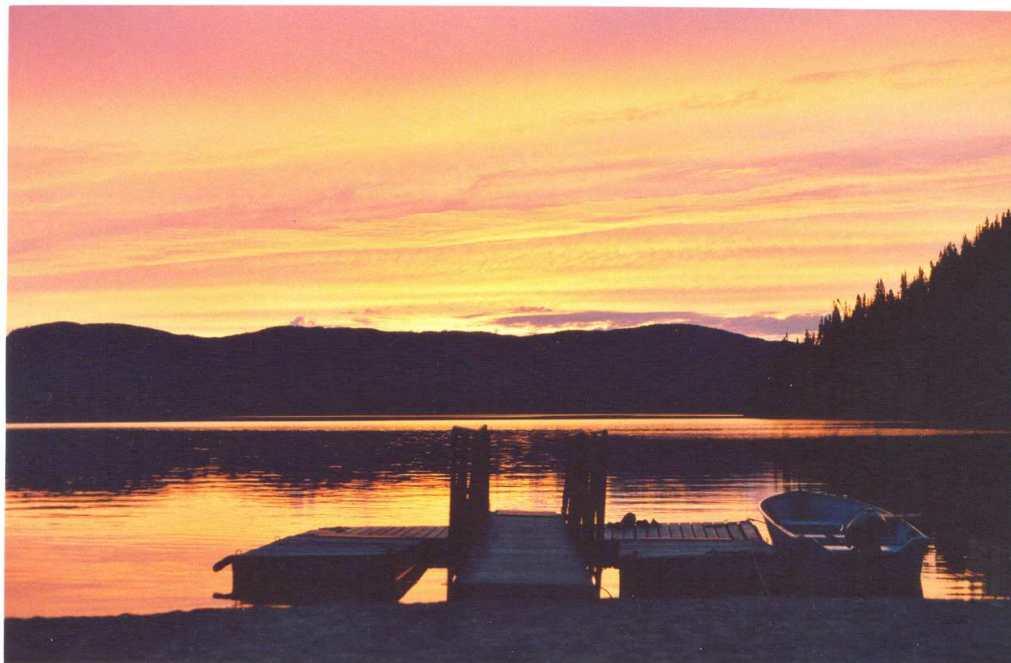
Coucher de soleil au-dessus du Lac Rapide